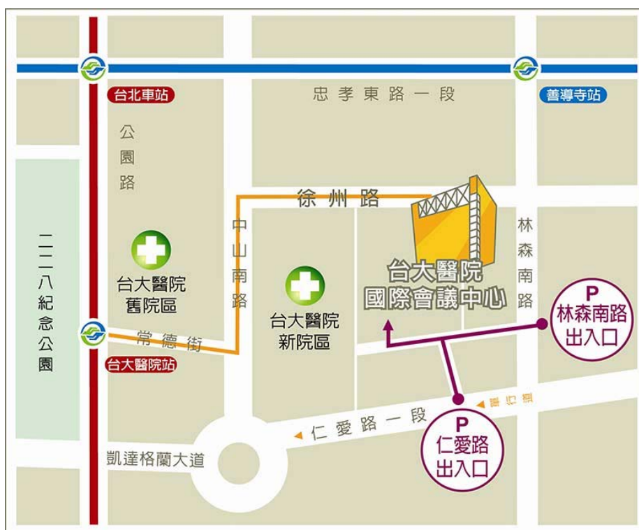
會議中心位置及停車動線圖